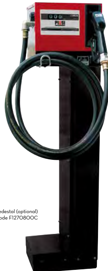
Pedestal (optional) Code F1270800C