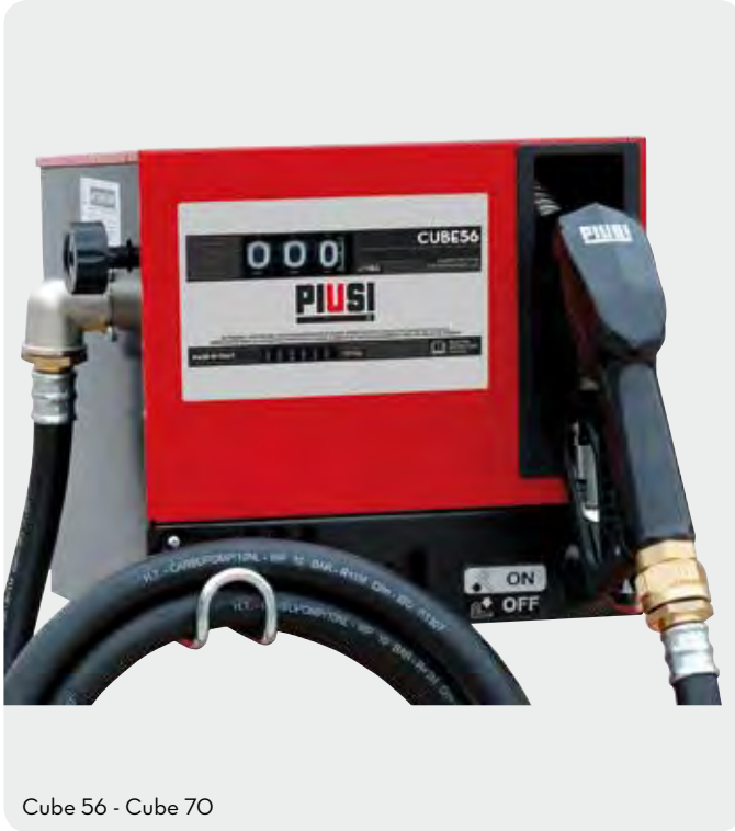
Cube 56 - Cube 70