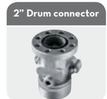
2" Drum connector