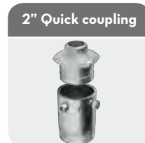
2" Quick coupling